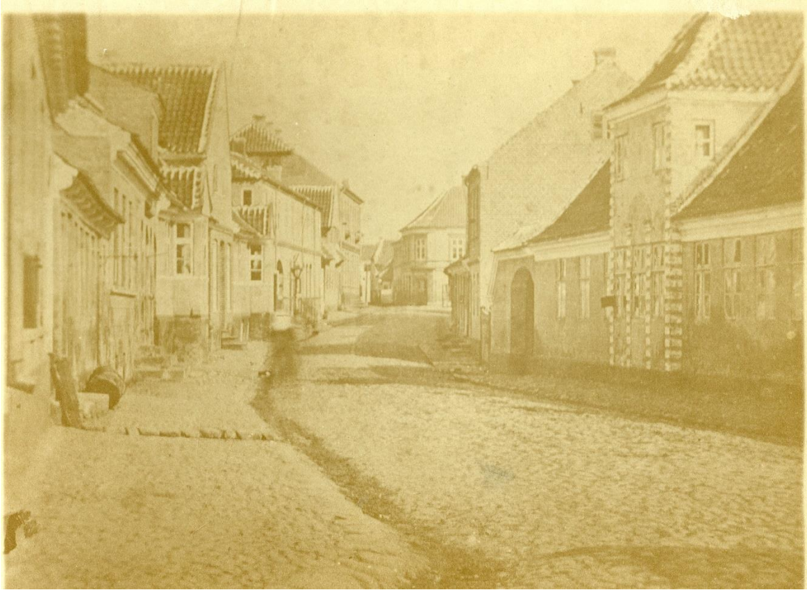
By- og herredsfoged Ole Selmer boede i ejendommen Adelgade 16 i Skive (bygningen på Adelgades venstre side med gavl til gaden og karnap). Ejendommen kaldes for "byfogedgården", idet den rummede kontor og bolig for de skiftende by- og herredsfogeder i Skive fra 1759 til 1859. Ejendommen blev revet ned i 1912 og erstattet af en ny bygning, tegnet af arkitekt Erik V. Lind, Skive.